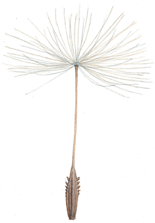
ILLUSTRASJON: HERMOD KARLSEN